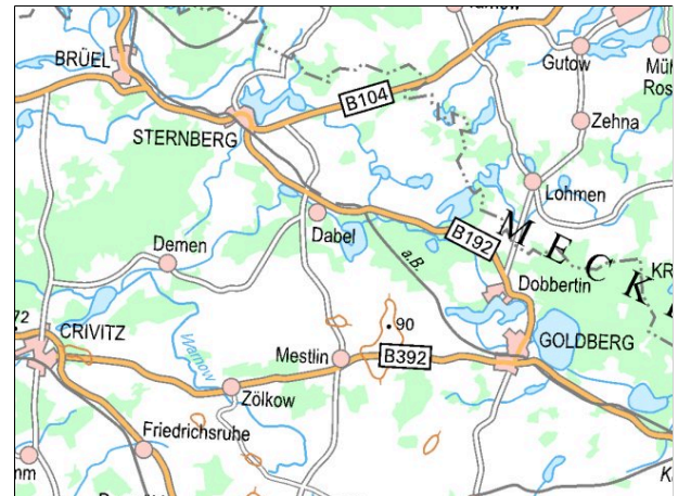
Kartenmaterial: © GeoBasis-DE/MV 2026; © Landesamt für Umwelt, Naturschutz und Geologie Mecklenburg-Vorpommern