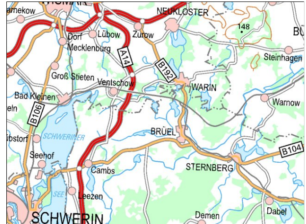
Kartenmaterial: © GeoBasis-DE/MV 2023; © Landesamt für Umwelt, Naturschutz und Geologie Mecklenburg-Vorpommern