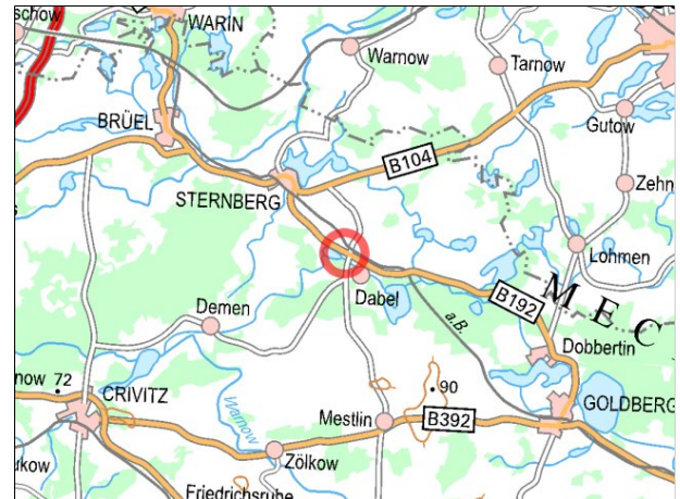
Kartenmaterial: © GeoBasis-DE/MV 2018; © Landesamt für Umwelt, Naturschutz und Geologie Mecklenburg-Vorpommern