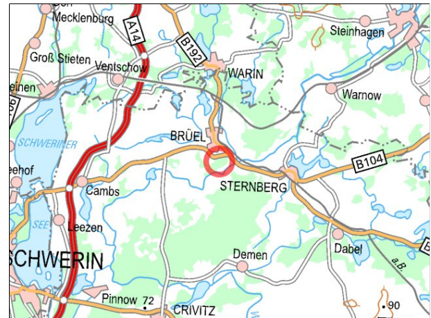
Kartenmaterial: © GeoBasis-DE/MV 2017; © Landesamt für Umwelt, Naturschutz und Geologie Mecklenburg-Vorpommern